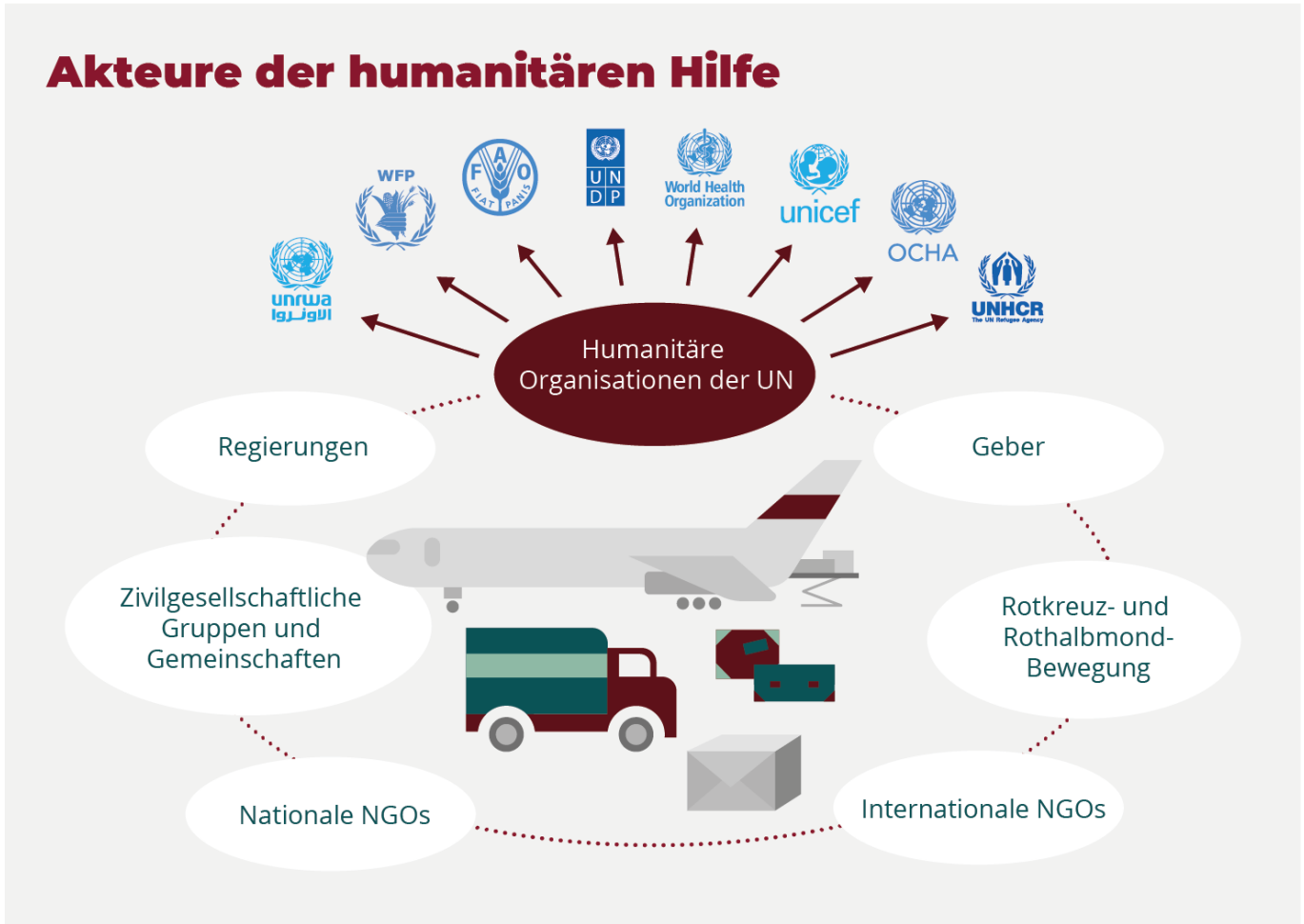
Grafik 1: Akteure der humanitären Hilfe

2014. Hinzu kommen weitere normative Grundlagen oder Selbstverpflichtungen, die humanitäre Akteure eingegangen sind. Ein Meilenstein in der Rechenschaftslegung humanitärer Hilfe sind die Sphere-Standards aus dem Jahr 2000, eine Formulierung von Mindeststandards etwa für die Trinkwasserversorgung, Notunterkünfte oder die Auslastung von Sanitäreinrichtungen.